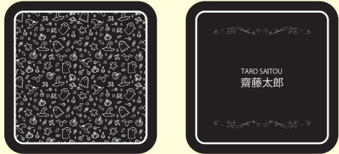
ホワイトチョコの凸の NG 例