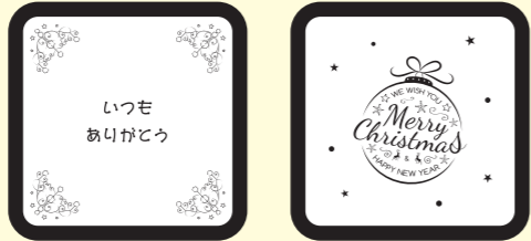
ホワイトチョコの凹の NG 例