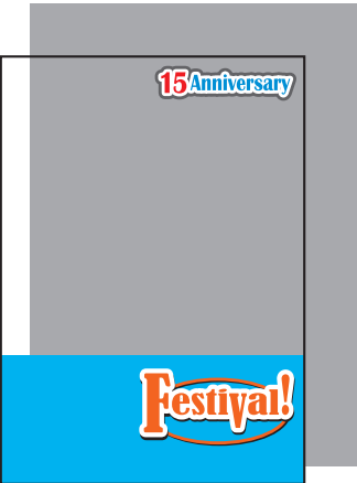
上の文字と下部のみ白版の場合 (白版を引いた部分以外は透けます。)