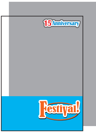
上の文字と下部のみ白版の場合 (白版を引いた部分以外は透けます。)