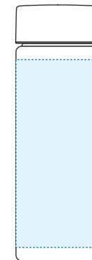
印刷位置イメージ