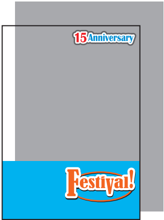
上の文字と下部のみ白版の場合 (白版を引いた部分以外は透けます。)