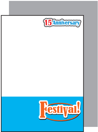
全面白版の場合 (全体に背景が透けにくくなります。)

クリアファイルの素材は透明なので、透けさせたくない部分と 白色で表現したい部分は、K100% (黒) で白版を制作してください。