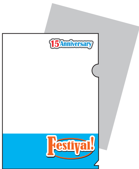
全面白版の場合 (全体に書類が透けにくくなります。)

クリアファイルの素材は透明なので、透けさせたくない部分と白色で表現したい部分は、白版を制作してください。