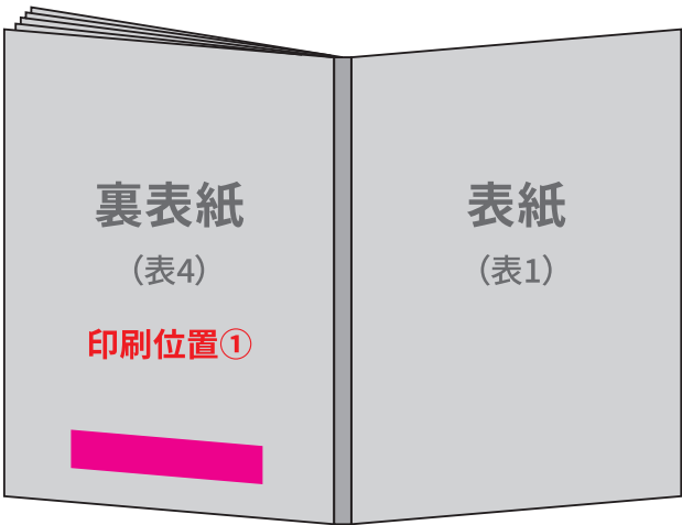
印刷位置: 下から15mm 左右中央