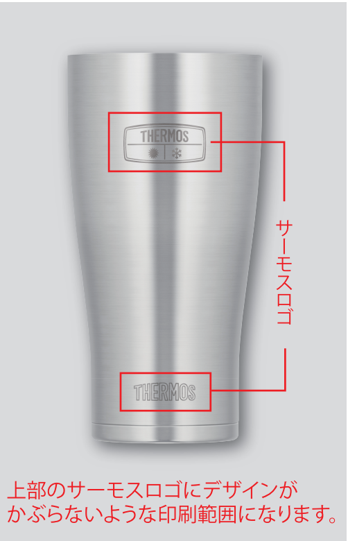
上部のサーモスロゴにデザインがかぶらないような印刷範囲になります。