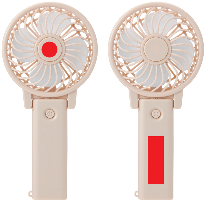
印刷位置 〈扇面中央〉