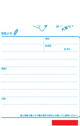
広げた時の書込み欄右下部