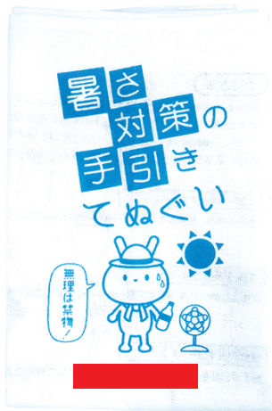
折り畳んだ時の中央イラスト下部