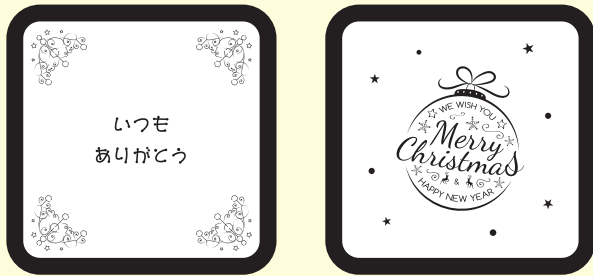
ホワイトチョコの凹の NG 例