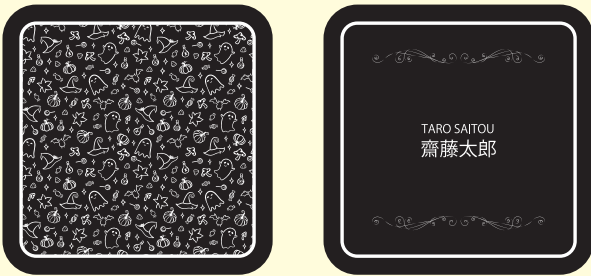
ホワイトチョコの凸の NG 例