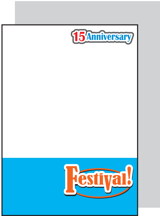
全面白版の場合 (全体に背景が透けにくくなります。)

商品の素材が透明ですので、透けさせたくない部分と白色で表現したい部分は、白版の制作が必要です。