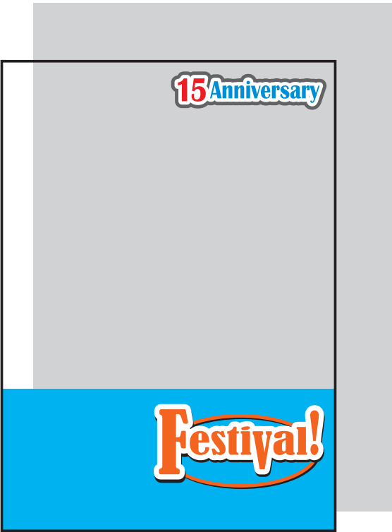
上の文字と下部のみ白版の場合 (白版を引いた部分以外は透けます。)